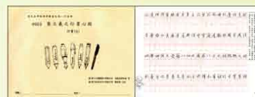
行書(5) 集王羲之行書心經(含簽字筆臨寫)