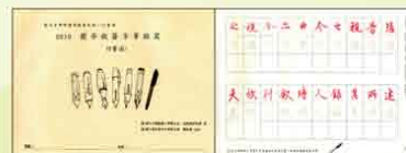
行書(6) 蘭亭敘簽字筆臨寫